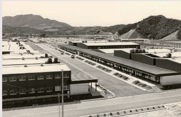
開設当時の有田焼卸団地の風景。その後、盛土による道路の嵩上げなどの改修工事が行われ、現在に至る。50年の歳月を経て、緑豊かな環境が育まれた。