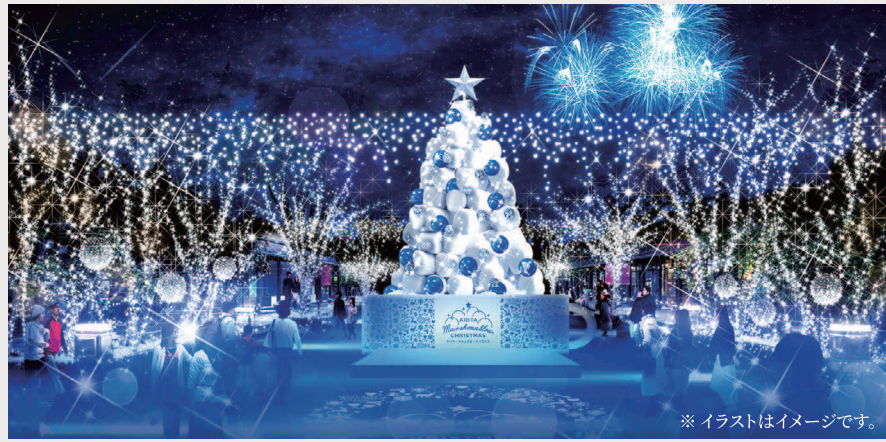
※イラストはイメージです。