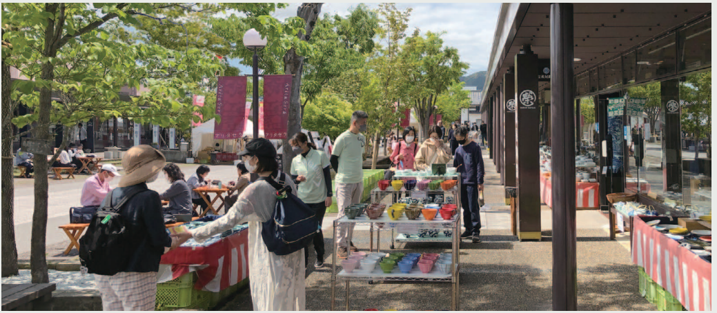
買い物や観光に毎年たくさんのお客さまが訪れる「有田陶器市」や「有田のちやわん祭り」