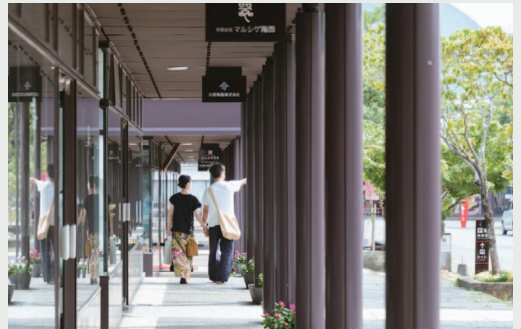
統一されたデザインの軒先が連なり、雨の日も 傘をささずにショッピングが楽しめるアーケード