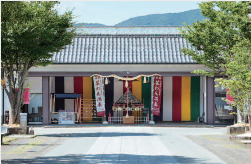
南館に常設している御神体「茶わん神輿」へと いざなう石畳の参道をイメージした中央大通り