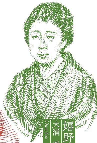
嬉野茶 大浦慶 Oura Kei